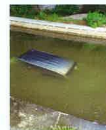
水没してしまった車を……

クレーン付きのレッカー車2台、隊員4名で出動しました。現場に着くと完全に水没し、川から出ている部分は車両の天井のみ。その天井にクレーンを使用して2人が登り捕縛作業を、残り2名はクレーン操作を行い引き上げるという大掛かりな作業となりました。水没していたこともあり通常の軽自動車より重量がありましたが、無事引き上げに成功しました!